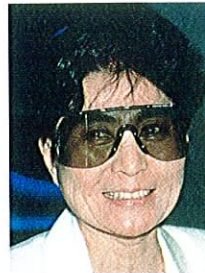
Yoko Ono: em fase Disney

John Lennon se apaixonou depois de extasiar-se com sua obra numa galeria de arte do Soho, em Nova York. A artista plástica Yoko Ono , 65 anos, expôs uma prosaica maçã para evidenciar a decomposição da fruta. Conhecida por criar esquisitices, ela vive agora uma aparente fase Disney. Em sua instalação "Add Collor