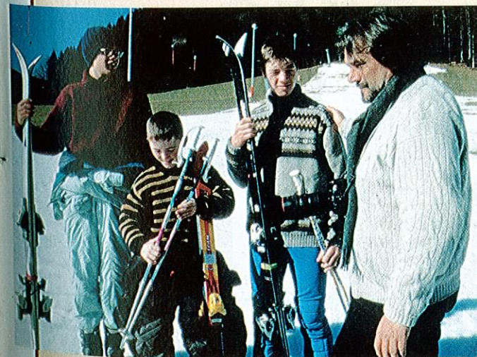
Toscani (à dir.): catálogo com deficientes

Ela compara a docilidade e a beleza dos girassóis que se movem na direção do sol à personalidade dos portadores de deficiência. Os jovens de uma instituição alemã foram clicados em situações corriqueiras, alegres e tristes, com suas famílias e professores. "Estúpida gente que só vê beleza em coisas bonitas", disparou o fotógrafo sobre o novo trabalho. "Eles são bonitos, no mais puro sentido da palavra."