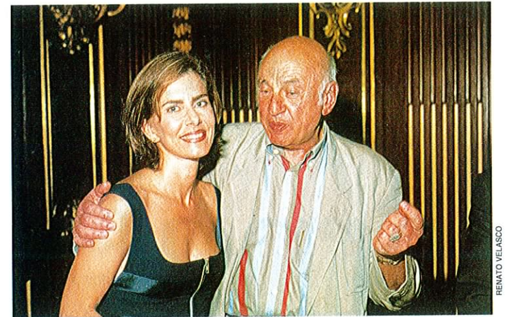
Maitê e o filósofo Morin: reflexões e abobrinhas

POR JANETE LEÃO FERAZ - Colaboraram: Clarisse Meireles (RJ), Isabela Abdala (DF), Luiza Villaméa, Carolina Trevisan e Gisele Vitória (SP)